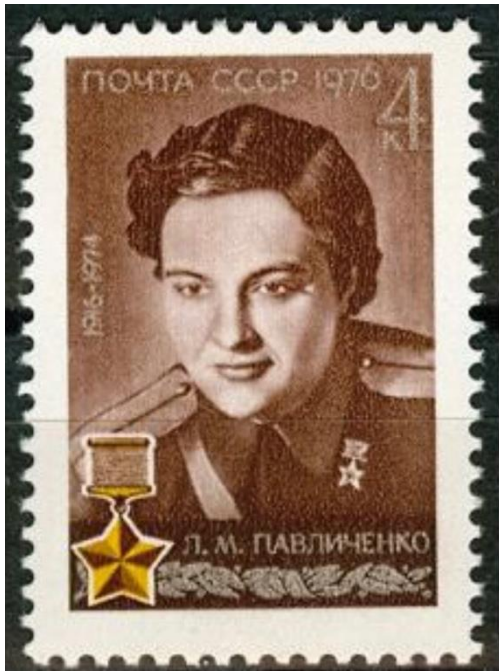
6. Образ Людмилы Павличенко на обложке одного из американских журналов. 1942г